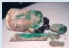
Bohrkern eines Hallenbodens mit grünen Chromverunreinigungen

Aus den Ergebnissen der Erkundung wird ein Rückbau- und Entsorgungskonzept erarbeitet. Es dokumentiert die ermittelten schadstoffhaltigen Gebäudebestandteile, zeigt die erforderlichen Arbeitsschritte für die Schadstoffabtrennung (Reihenfolge, geeignete Verfahren) auf, nennt die Anforderungen an den Arbeits- und Immissionsschutz und schlägt mögliche Entsorgungswege vor.