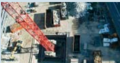
unkontrollierter Abbruch mit unzureichender Abfalltrennung